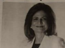
Vicepresidenta de la república, Raquel Peña.

"Estoy totalmente de acuerdo con monseñor-dijo para agregar que nosotros como servidores públicos estamos para servirle al pueblo dominicano y así hacemos patria. En un día como hoy 30 de marzo, nosotros hacemos patria